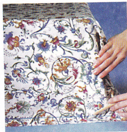
Маркером с легко удаляющейся краской разметьте линию соприкосновения ткани с полом и затем линию припусков подгибки низа.

Повторите ту же операцию для спинки кресла, драпируя ткань сначала спереди до доски сиденья, а затем сзади, до пола. Задрапируйте углы и обработайте подгибкой нижний край.